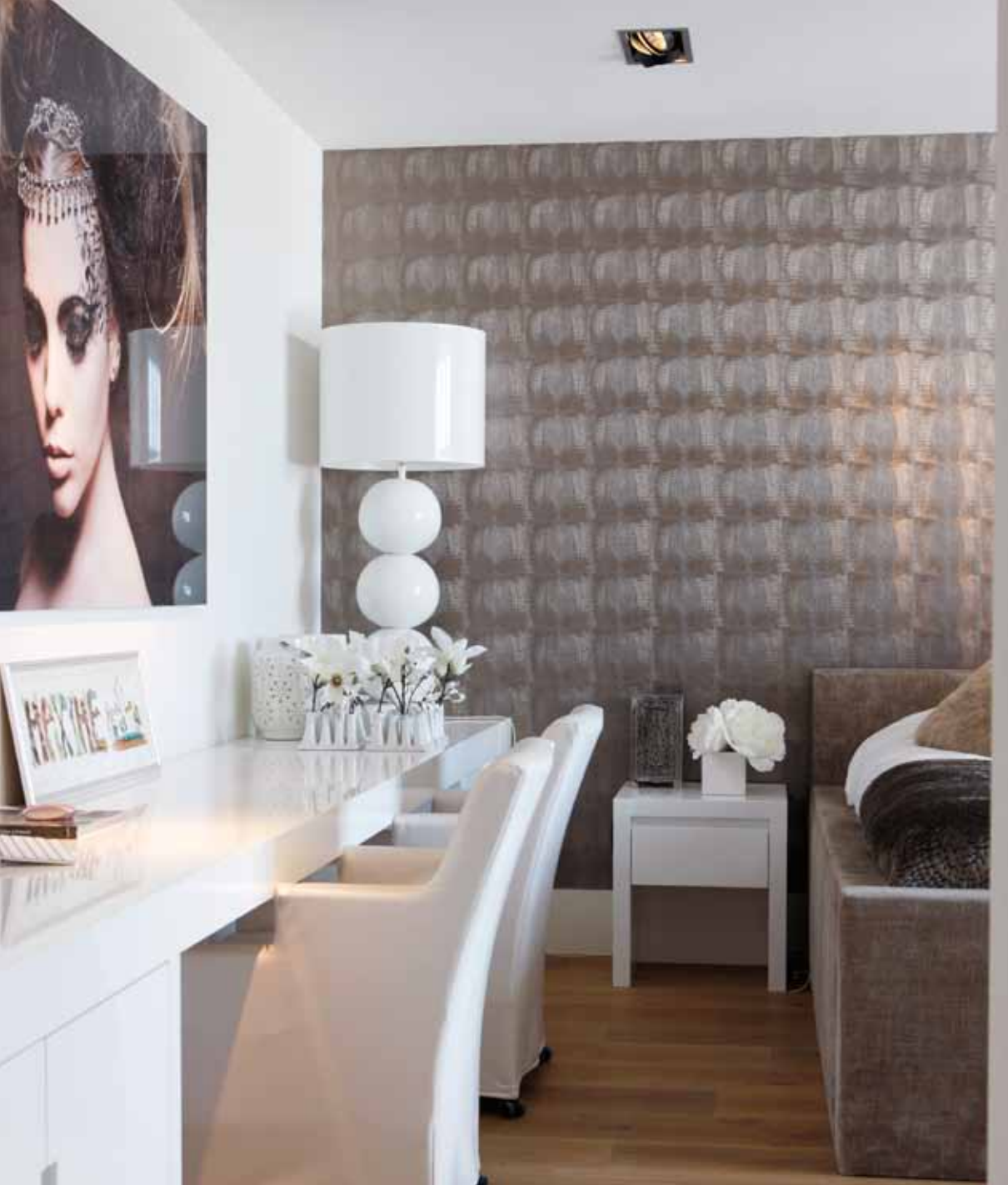
De kamer van de dochter kreeg mooie fluwelen stoffen en behang met een subtiele slangenprint. Zowel het bureau als de raambank werden in witte hoogglans gerealiseerd.